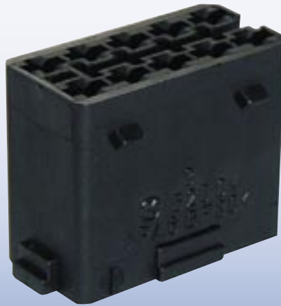
Steckhülsegehäuse 10-fach Receptacle housings 10-fold