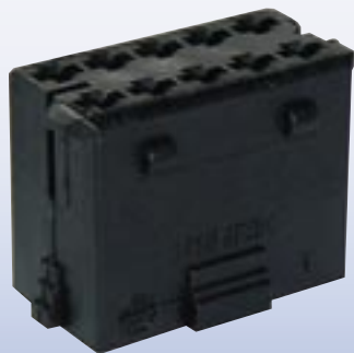
Steckhülsegehäuse 10-polig Receptacle housings 10-pole